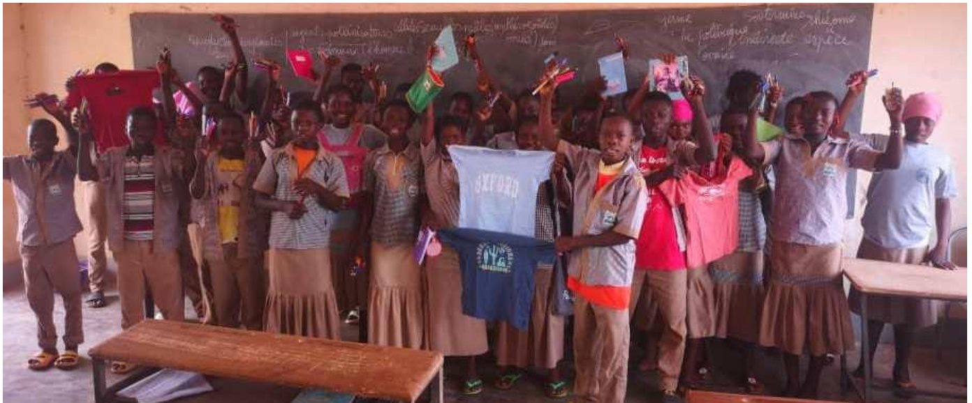
Les fournitures scolaires et vêtements destinés aux élèves, ont été distribués le 13 Avril 2023.

Les deux ordinateurs portables, l'ensemble des fournitures scolaires et les vêtements qui avaient été envoyés pour le travail de l'association, du lycée Bater-Langou et pour soutenir les élèves sont bien arrivés. Merci beaucoup